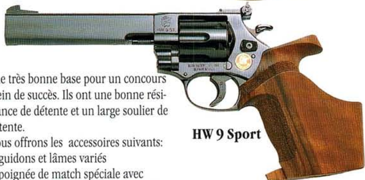
HW 9 Sport