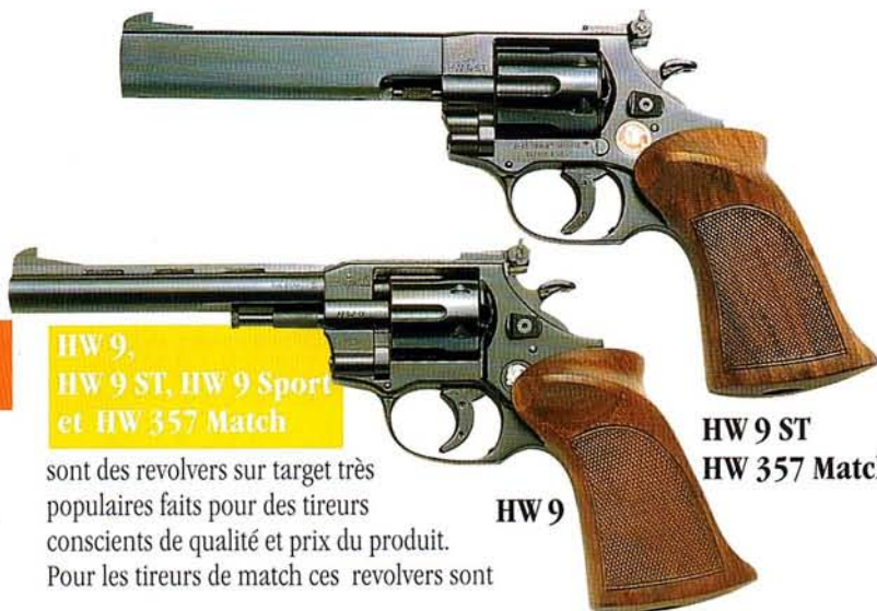
HW 9 ST HW 357 Match

sont des revolvers sur target très populaires faits pour des tireurs conscients de qualité et prix du produit. Pour les tireurs de match ces revolvers sont