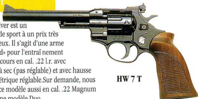
HW 7 T

Ce revolver est un modèle de sport à un prix très avantageux. Il s'agit d'une arme «allround» pour l'entraînement et le concours en cal. .22 l.r. avec détente à sec (pas réglable) et avec hausse micrométrique réglable. Sur demande, nous offrons ce modèle aussi en cal. .22 Magnum ou comme modèle Duo.