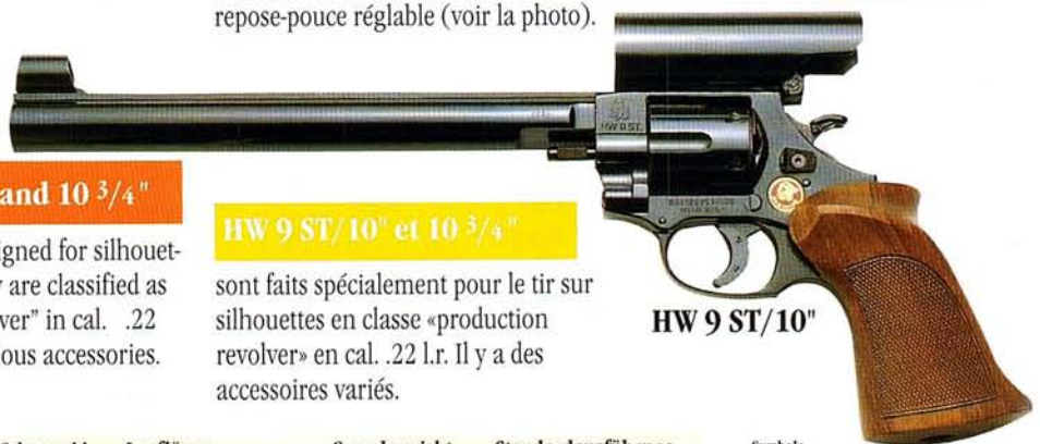
HW 9 ST/10"

sont faits spécialement pour le tir sur silhouettes en classe «production revolver» en cal. .22 l.r. Il y a des accessoires variés.